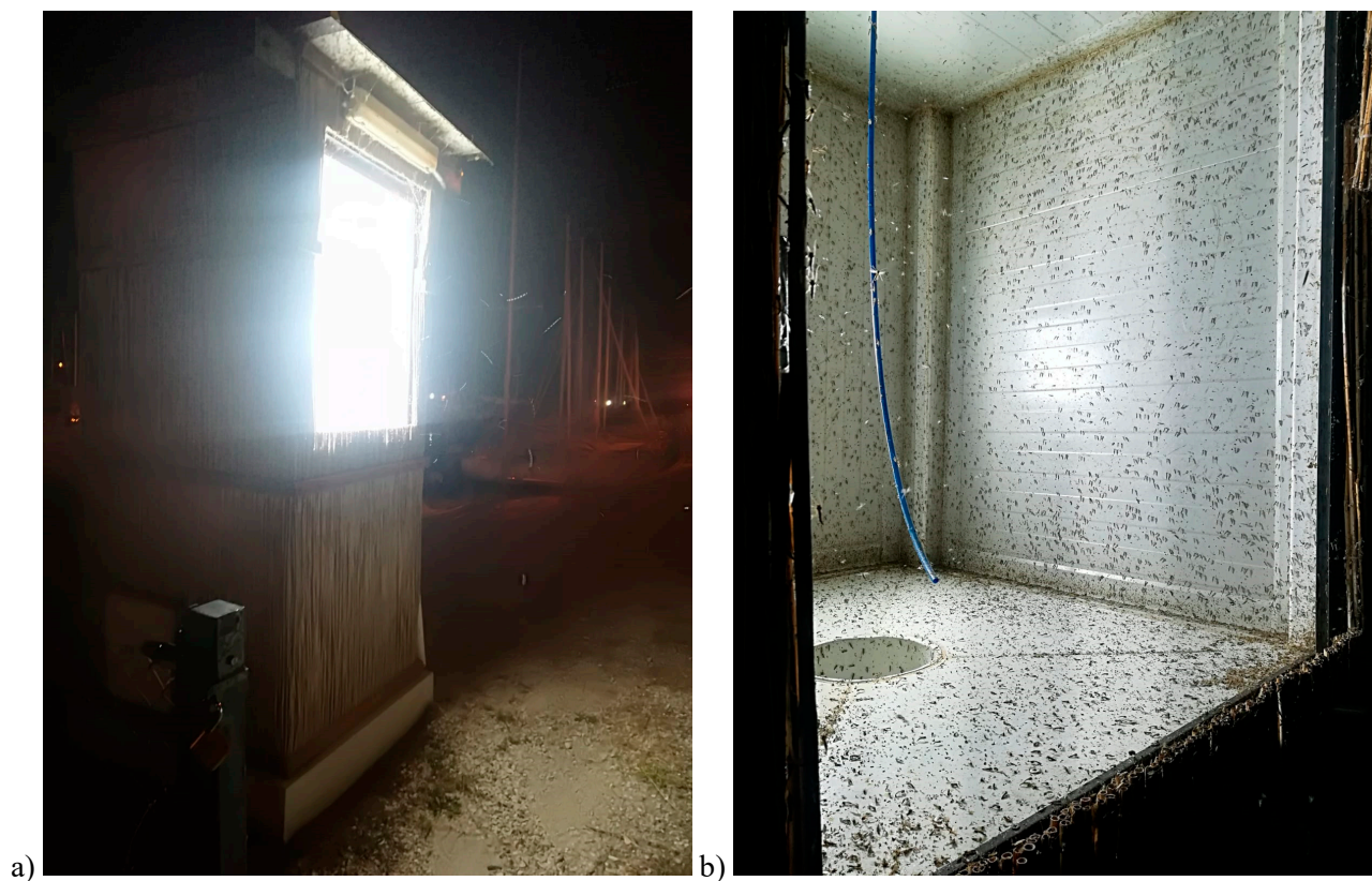
Figure S2. a) ChiroTrap in operation; b) internal attraction and aspiration chamber of the ChiroTrap.