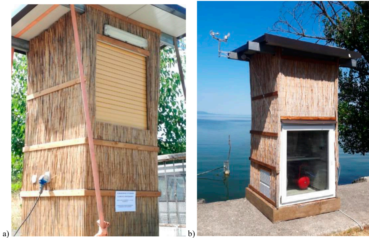
Figure S1. ChiroTrap: a) front side; b) back side.