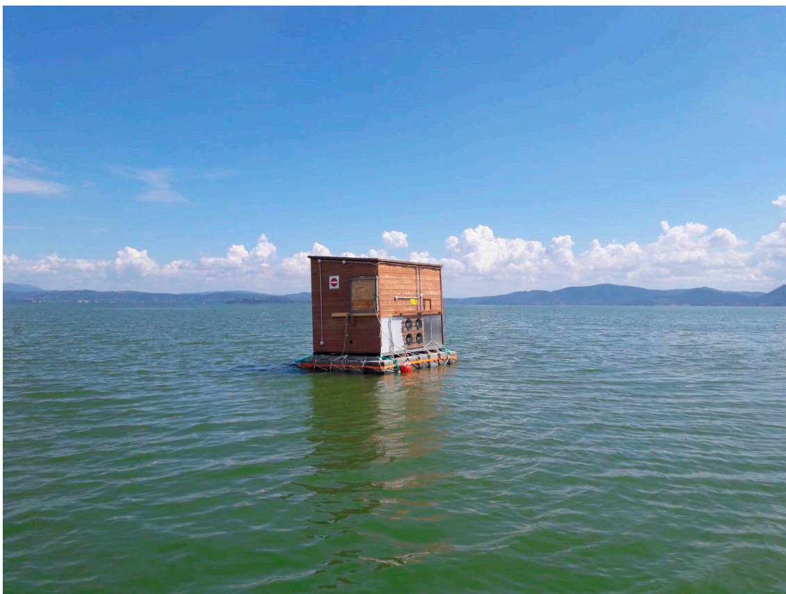
Figure S4. ChiroBoat - http://www.lakex.eu/ .